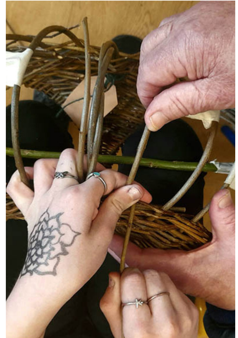
The Company of Trees 2

Tá tuilleadh sonraí faoin Tionscnamh maidir le hOileán Comhroinnte le fáil ar www.gov.ie/sharedisland