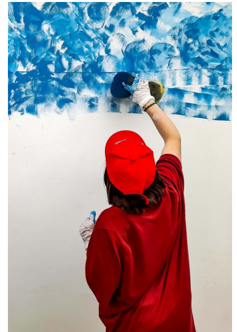
The Company of Trees