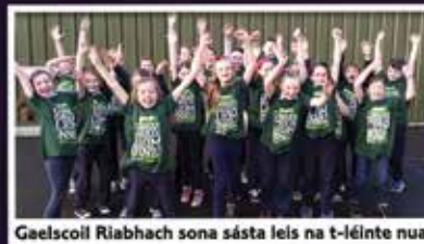
Gaelscoil Riabhach sona sásta leis na t-léinte nua