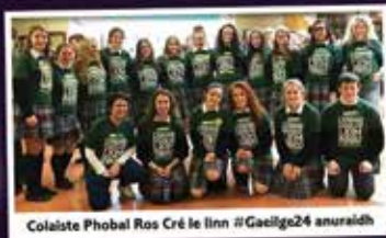
Colaiste Phobal Ros Cré le linn #Gaeilge24 anuraidh