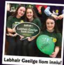
Labhair Gaeilge liom inniu!