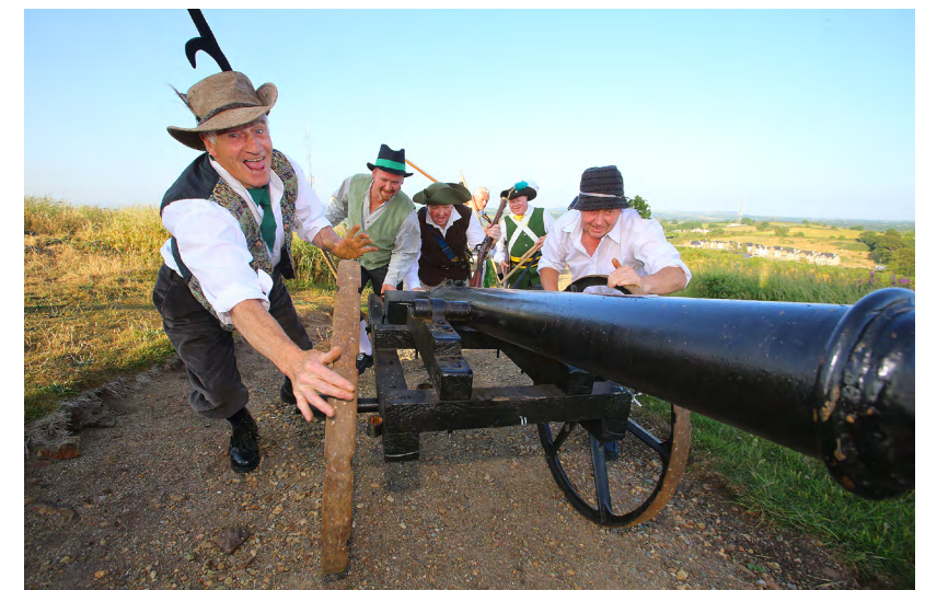
Vinegar Hill Historical Re- enactment

Our aim is to ensure that culture, heritage and creativity contribute to our society, economy and environment, and that as many people as possible can take advantage of an equality of opportunity to access cultural experiences through a collaborative and coordinated approach to forward planning and public service delivery.