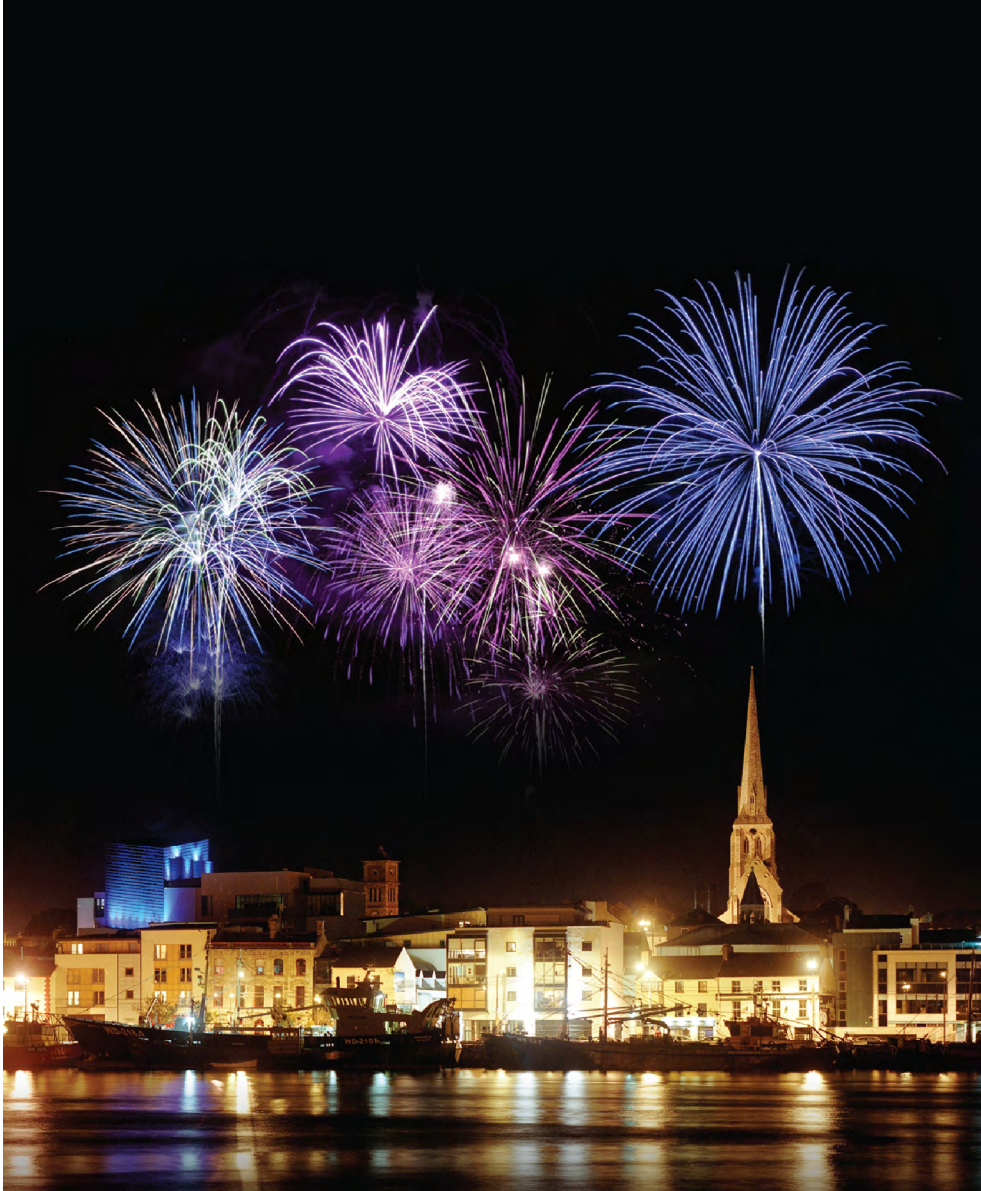
Wexford Opera Festival Opening Night Fireworks